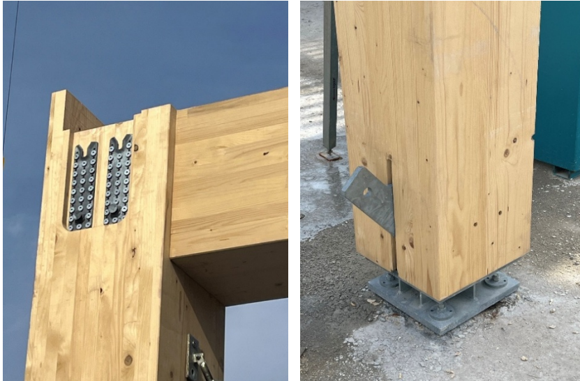
Éléments bois