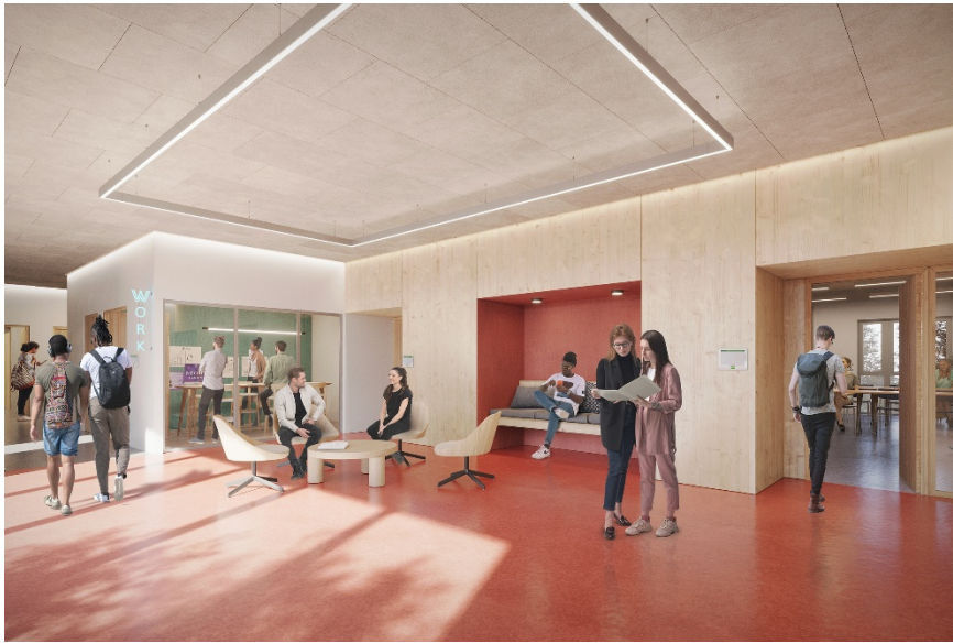
Espaces informels @Vivid Vision