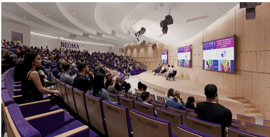
Auditorium @Vivid Vision