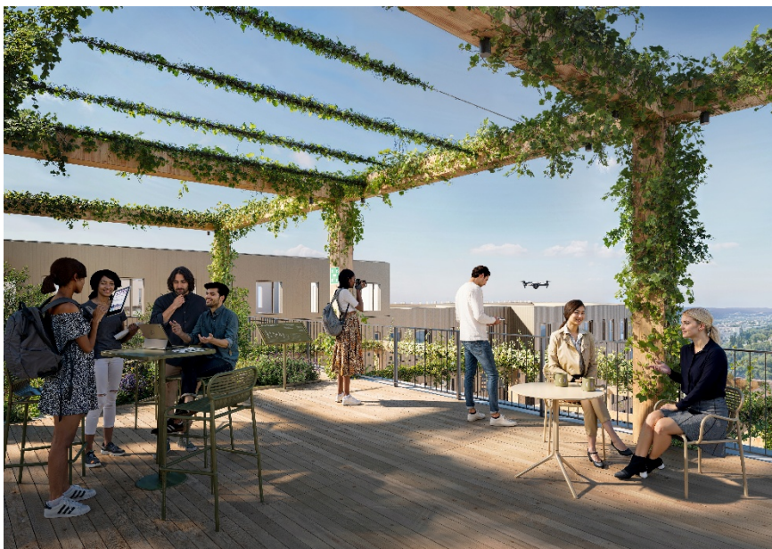
Terrasses et pergola en bois @Vivid Vision