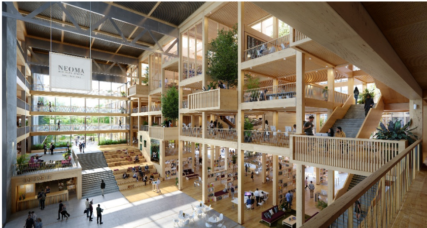
Ruche, coeur du campus