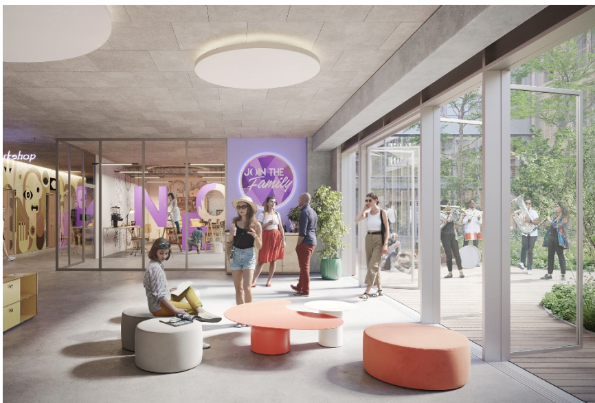
Forum des associations étudiantes @Vivid Vision