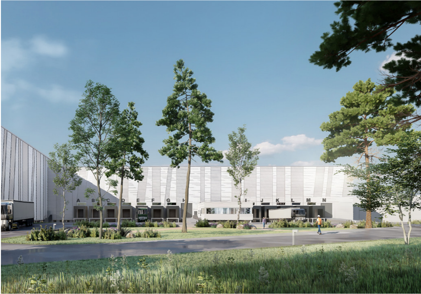
Quais - P16