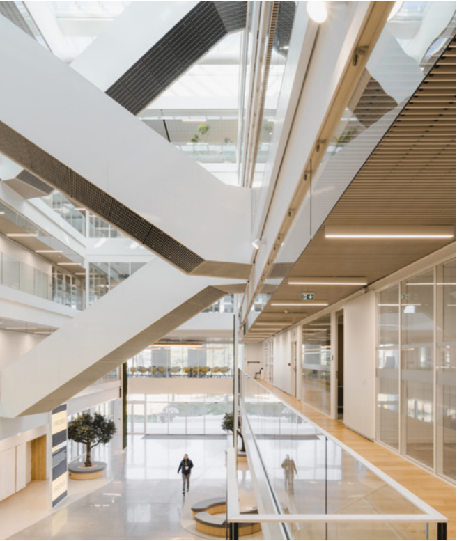
Hall - P17