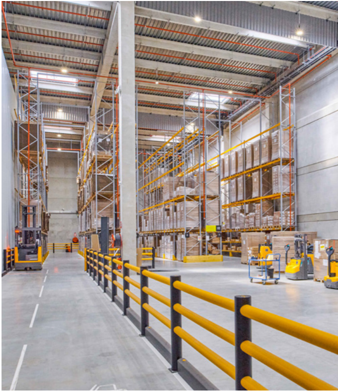
Vues intérieures transstockeur et atelier