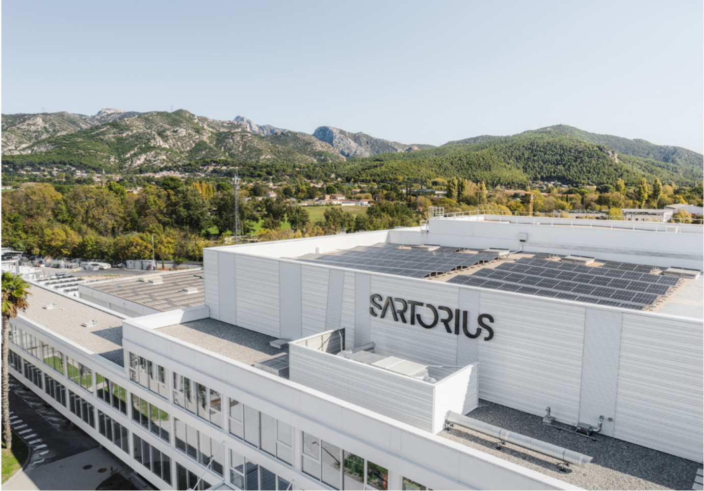
Vue extérieure - P16