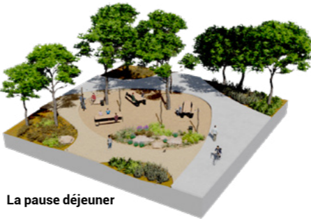
La pause déjeuner